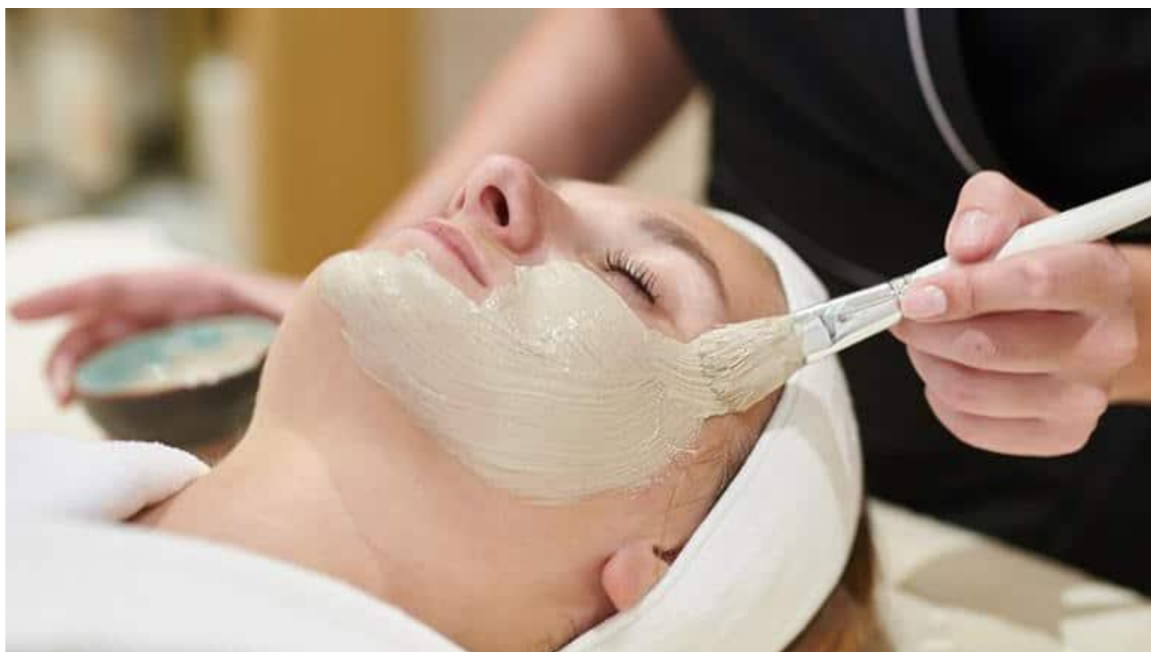
Une escapade bien-être