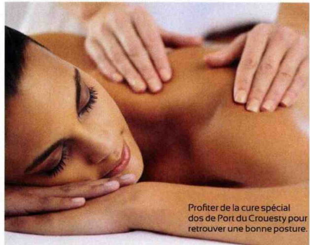
Profiter de la cure spécial dos de Port du Croesty pour retrouver une bonne posture.