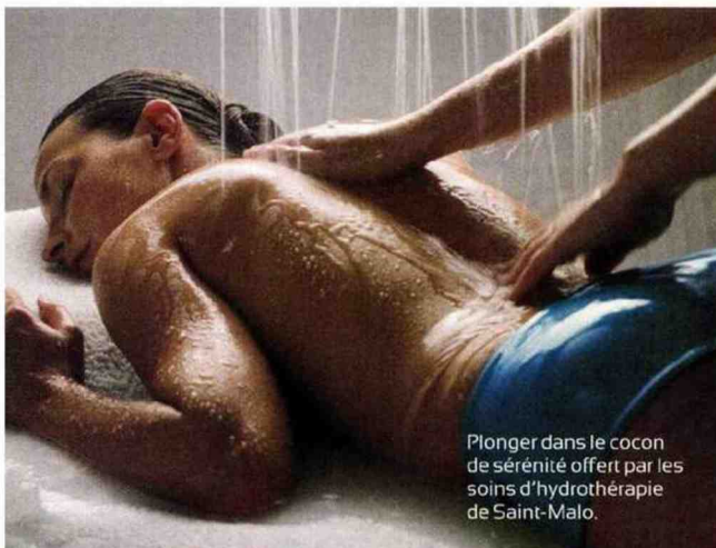
Plonger dans le cocon de sérénité offert par les soins d'hydrothérapie de Saint-Malo.

Mer et remise en forme , 6 jours-6 nuits en demi-pension à partir de 1758 € par personne au Grand Hôtel des Thermes****. Tél. : 0299407500 et thalasso-saintmalo.com